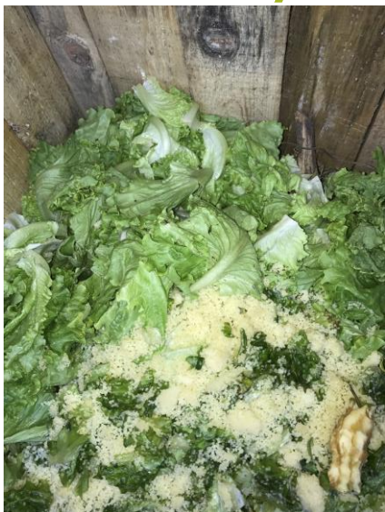
déchets mis dans le composteur

Expérience sur la décomposition des déchets du goûter